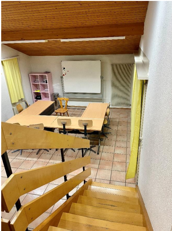
Raum für Kleingruppenunterricht in ehemaliger Hauswartwohnung