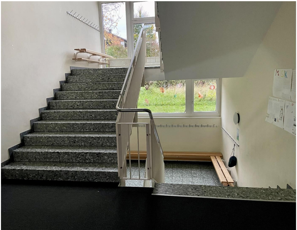
Garderoben im Treppenhaus (fehlende Brandabschnitte))