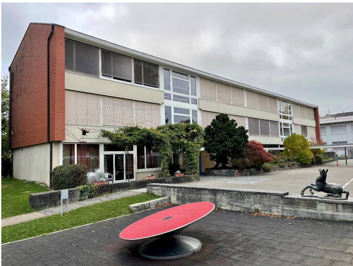
Trakt C (Baujahr 1959)